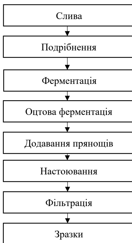
Рисунок 2.1. Принципова схема отримання дослідних зразків сливового оцту з прянощами

Для наочного відображення послідовності технологічних операцій у процесі виготовлення дослідних зразків сливового оцту розроблено відповідну технологічну схему, подану на рисунку 2.1. Вона демонструє поетапний перебіг переробки сировини від підготовки плодів до отримання готових зразків для подальших досліджень.