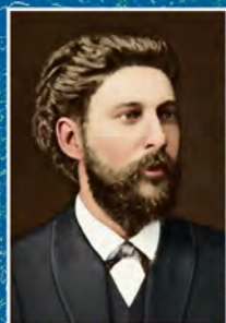
ОВСИНСЬКИЙ Іван Євгенович (бл. 1856–1910)