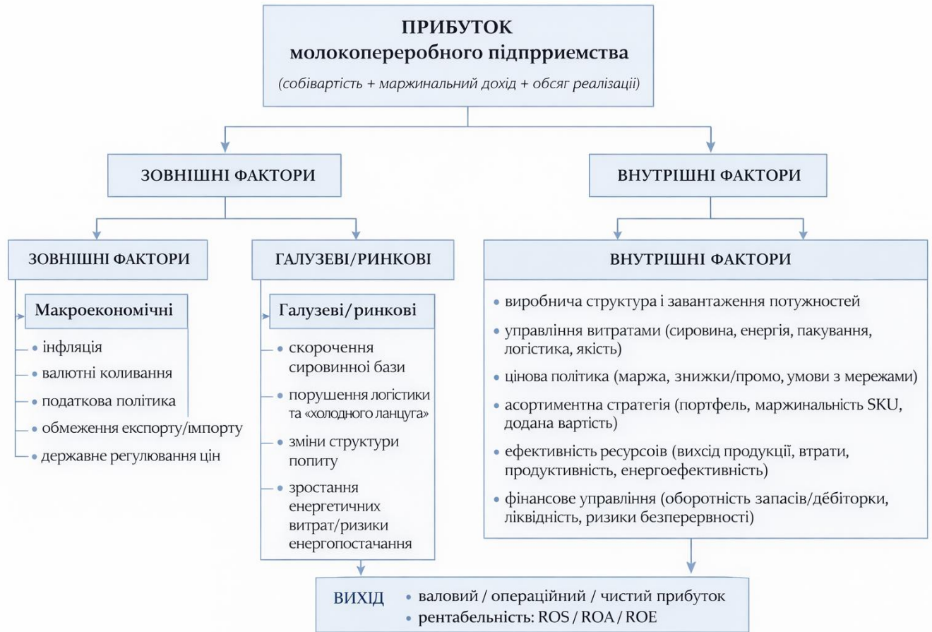
Рис. 1.1 Схема впливу зовнішніх та внутрішніх факторів на прибуток молочнопереробного підприємства

Така взаємодія зумовлює зміну валового, операційного та чистого прибутку, а також показників рентабельності продажу, активів та власного капіталу, що обґрунтовує необхідність комплексного аналізу факторів прибутковості та застосування адаптивних управлінських інструментів.