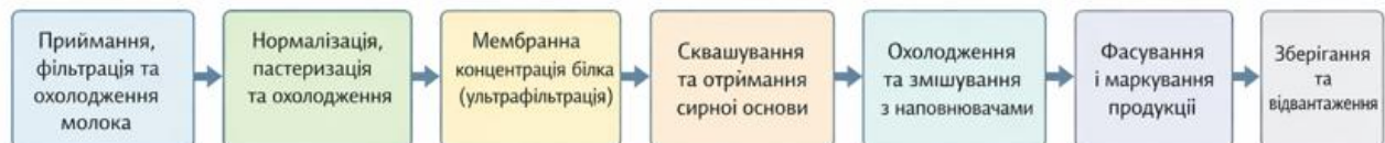
Рис. 3.2 Схема технологічного процесу виробництва молочних білкових перекусів у промислових умовах

Виробництво молочних білкових перекусів у промислових умовах базується на послідовному виконанні взаємопов'язаних технологічних операцій, спрямованих на забезпечення високої харчової цінності, безпечності та стабільних органолептичних властивостей готового продукту. Особливістю даної технології є використання сучасних методів оброблення молочної сировини, зокрема нормалізації складу, теплової обробки, мембранної концентрації білка та керованого сквашування, що дозволяє отримати продукт із підвищеним вмістом білка та заданою консистенцією. Важливим елементом процесу є також введення наповнювачів і смакових компонентів, фасування у герметичну тару та забезпечення безперервного «холодного ланцюга» під час зберігання й транспортування, що гарантує мікробіологічну стабільність і подовження строку придатності продукції. Узагальнену послідовність основних стадій виробництва молочних білкових перекусів наведено на рис. 3.2