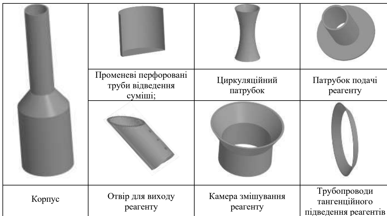
Рисунок 3 – Окремі елементи апарат-змішувачів

Для формування об'ємної структури застосовуються методи переміщення (для отримання граней) або обертання (для створення тіл обертання) плоских геометричних контурів. У процесі лінійного переміщення плоского ескізу виникає тривимірне тіло, яке фактично є проекцією основи майбутньої моделі. Такі маніпуляції надають можливість гнучко коригувати параметри побудови та характеристики самого об'єкта. Крім того, робочий контур може бути сформований шляхом копіювання графічних даних із раніше розроблених креслень або окремих фрагментів документації.