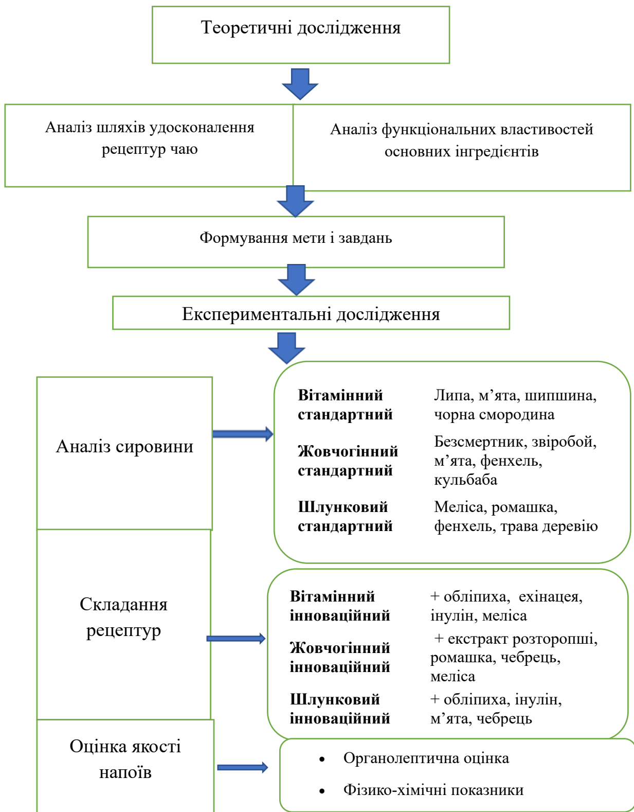
Рис.2.1. Програма досліджень