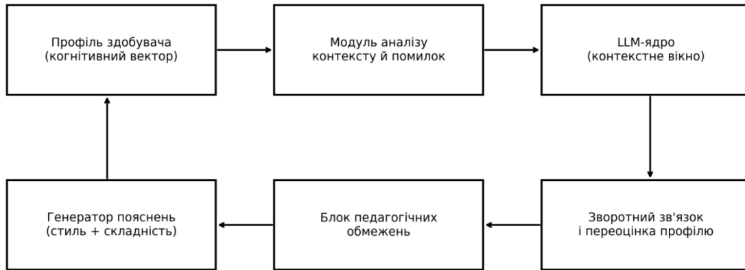
Рис. 1. Архітектура моделі персоналізації з динамічною генерацією пояснень

індикатор когнітивного навантаження. Оцінювання компонентів відбувається за гібридною схемою: мікротести, поведінкові логи та аналіз мовленнєвих актів у діалозі.