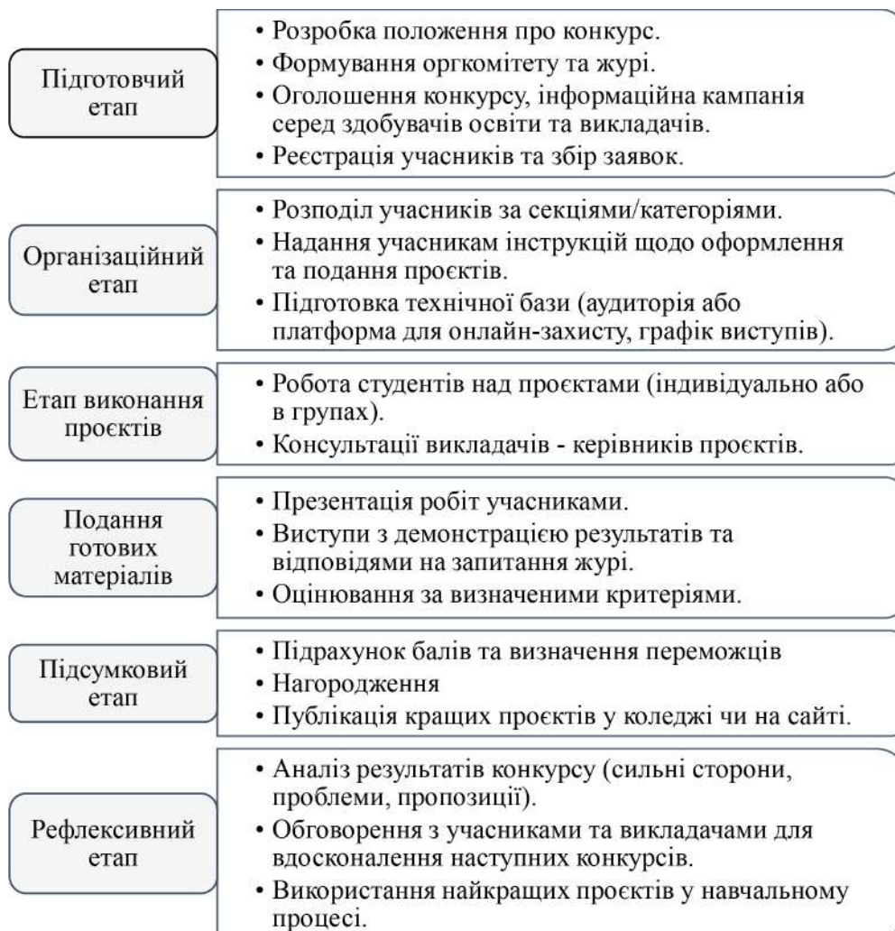
Рис. 2. Етапи проведення конкурсу проєктів

Мотиваційний ефект від конкурсу проєктів відбувається завдяки створенню ситуації успіху: студенти прагнуть показати себе, що стимулює їх до глибшого опрацювання матеріалу. З'являється зовнішня мотивація – визнання, нагороди та внутрішня мотивація – цікавість, самореалізація.