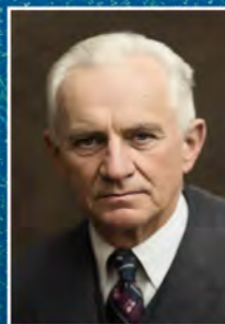
МАХОВ Григорій Григорович (1886–1952)