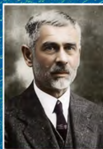
ВИНОГРАДСЬКИЙ Сергій Миколайович (1856–1953)