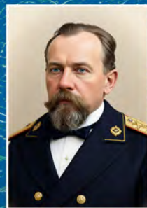
ТАРХОВ Костянтин Іванович (1856–1916)