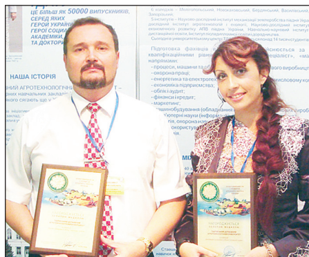
ТДАТУ здобув дві золоті медалі.

Мета проведення виставки - всебічне сприяння реалізації державної аграрної політики, економічному зростанню сільськогосподарського виробництва; оцінка потенціалу українського ринку, його інвестиційної привабливості; сприяння процесам розвитку міжнародного співробітництва в агропромисловому комплексі; налагодження ділових контактів між науковими організаціями та наукововиробничими підприємствами з метою створення спільних проектів на проведення досліджень і розробок; презентація досягнень кращих господарств і сільськогосподарських підприємств усіх областей України, стану їх діяльності та обміну позитивним досвідом у роботі; демонстрація кращих зразків світового та вітчизняного виробництва сільськогосподарської техніки, засобів механізації, обладнання для