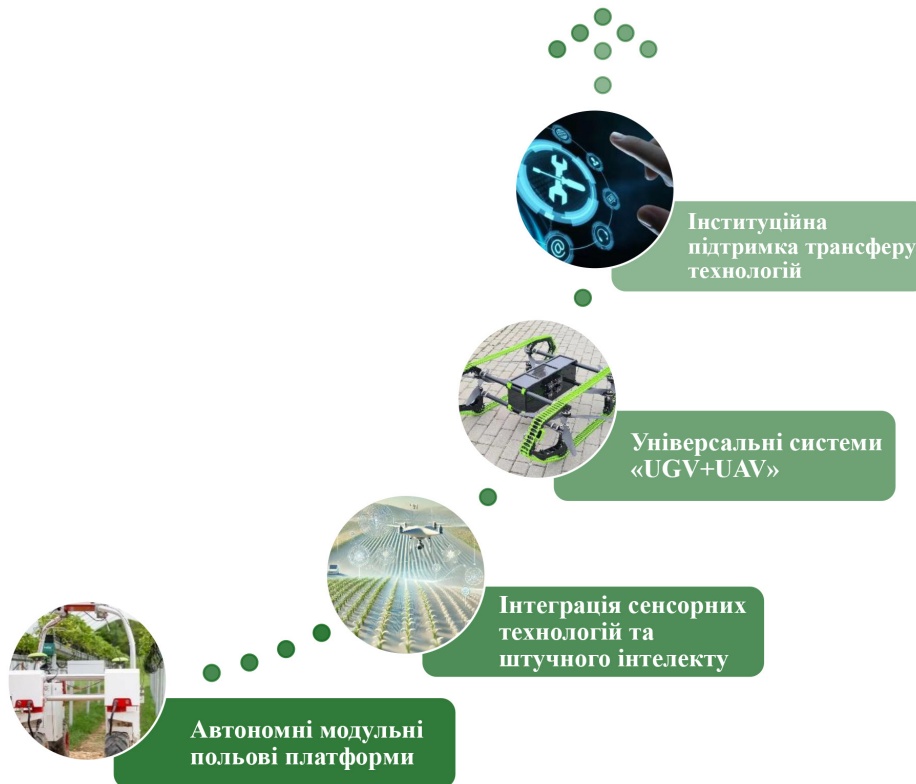
Рис. 1. Сучасні науково-технічні підходи до впровадження роботизованих систем у рослинництві

та машинного навчання для розпізнавання культур і бур'янів у реальному часі. Застосування таких алгоритмів дає змогу здійснювати прецизійне прополювання, дозоване внесення ЗЗР та контроль фітосанітарного стану без втручання людини [16].