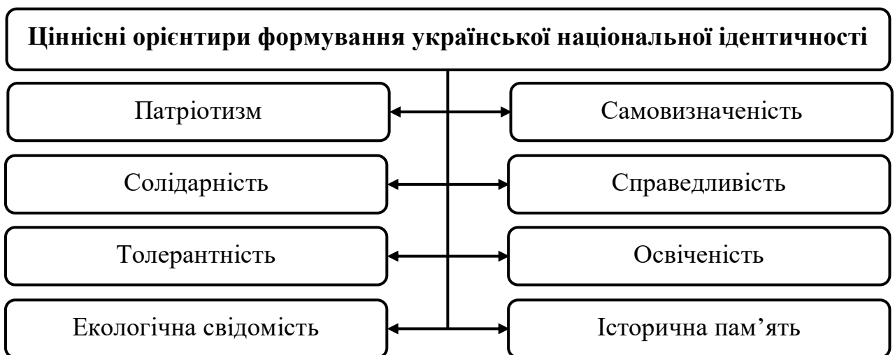
Рис. 2 Ціннісні орієнтири формування української національної ідентичності

Ціннісні орієнтири грають ключову роль у формуванні національної ідентичності України, оскільки вони визначають те, що українці вважають важливим, цінним та характерним для своєї нації. На сьогодні серед основних ціннісних орієнтирів формування української національної ідентичності виокремлюють ті, що справді є вагомими (рис. 2).