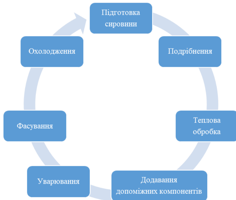
Рис. 2.1 – Технологічна схема виробництва плодово-ягідного соусу функціонального призначення [11,12]

Після уварювання соус охолоджують до температури 60–65 °С і фасують у стерильну скляну або полімерну тару. Фінальним етапом є пастеризація або стерилізація залежно від терміну зберігання, після чого продукція надходить на охолодження і маркування.