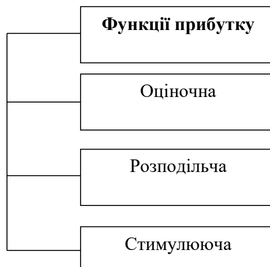
Рис. 1.1 Функції прибутку

Прибуток є джерелом нарощування капіталу підприємства, виплат дивідендів акціонерам (пайовикам), створення фондів підприємства тощо. На основі прибутку підприємства визначається його рейтинг. Разом з тим, прибуток є інструментом управління діяльністю підприємства. На основі результатів аналізу прибутковості приймаються управлінські фінансові рішення, направлені на підвищення ефективності функцій, що виконує прибуток: оціночної, розподільчої, стимулюючої (рис.1.1).