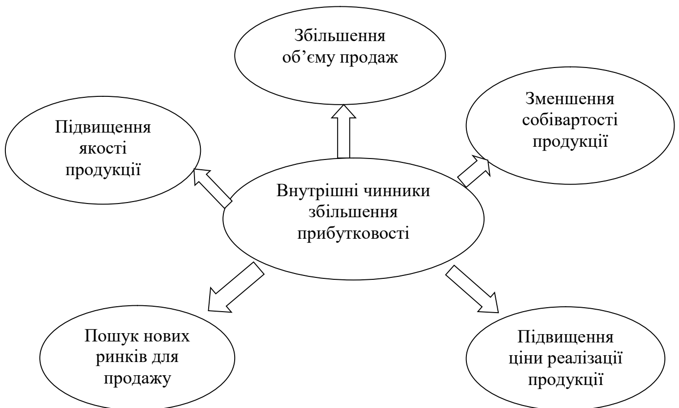
Рис. 1.4. Внутрішні фактори щодо забезпечення зростання прибутковості підприємства

Внутрішні фактори - це умови, які склались в межах безпосередньо самого підприємства і які можна проконтролювати та здійснити вплив на їх формування (рис. 1.4.).