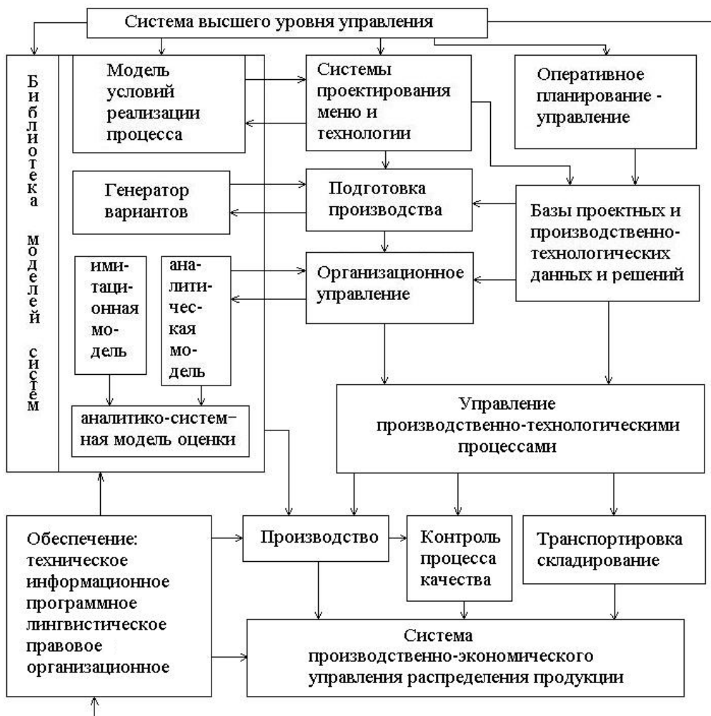
Рис. 1. Функциональная структура анализа и синтеза моделей сквозных алгоритмов управления

Структура такой модели анализа и синтеза подсистемы сквозных алгоритмов управления показана на рис. 1. Функциональная структура имеет иерархическую организацию и реализуется на основе декомпозиции сквозного управления на уровни: индивидуального управления, группового управления, управления заданиями (табл. 1). Индивидуальное управление рассматривается на локальном уровне, где в библиотеке имеются алгоритмы управления движением машинами, агрегатами и комплексами и временными последовательностями их работы.