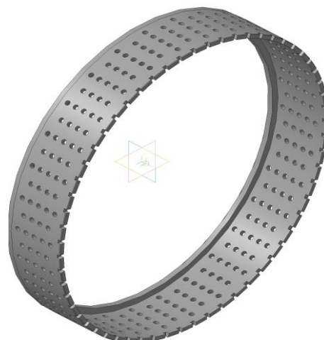
Рис. 2 – Робочі колеса дезінтегратора: 1 – робочі диски; 2 – робочі кільця. Рис.3 – Робоче кільце.

При зіткненні біомаси з отворами відбувається подрібнення за рахунок удару, а в зазорі між обертовими назустріч один одному колесами, відбувається подрібнення стиранням. Зовнішній вигляд робочого колеса представлений на рис. 3.