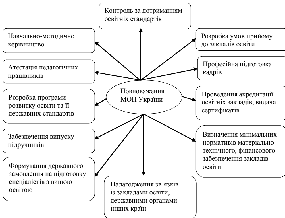
Рис. 2. Повноваження МОН України

забезпечення навчального процесу. Виконання основних функцій держави щодо освіти покладено на обласні державні адміністрації та обласні й міські управління освіти. Обов'язками органів місцевої влади є фінансування та забезпечення соціального захисту дітей, визначення мережі закладів освіти, а також ведення їх обліку та здійснення контролю за їх діяльністю.