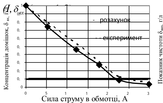
Рис. 1. Залежність показника чистоти МОР при зміні струму в обмотці при \delta_{вх} = 1 г/л.

За результатами експерименту були отримані данні, які зв'язують значення показника чистоти МОР з технологічними і конструкційними параметрами магнітного відстійника \delta_{вх} = f