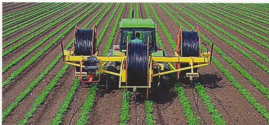
Рис. 3. Укладка поливної стрічки.

При економії води та мінеральних добрив утворюються для рослин сприятливі умови для розвитку. Зрошувальна трубка вкладається до посіву (посадки), що дозволяє відразу після посіву почати полив й отримати гарантовані сходи. Трубки краще укласти по поверхні ґрунту.