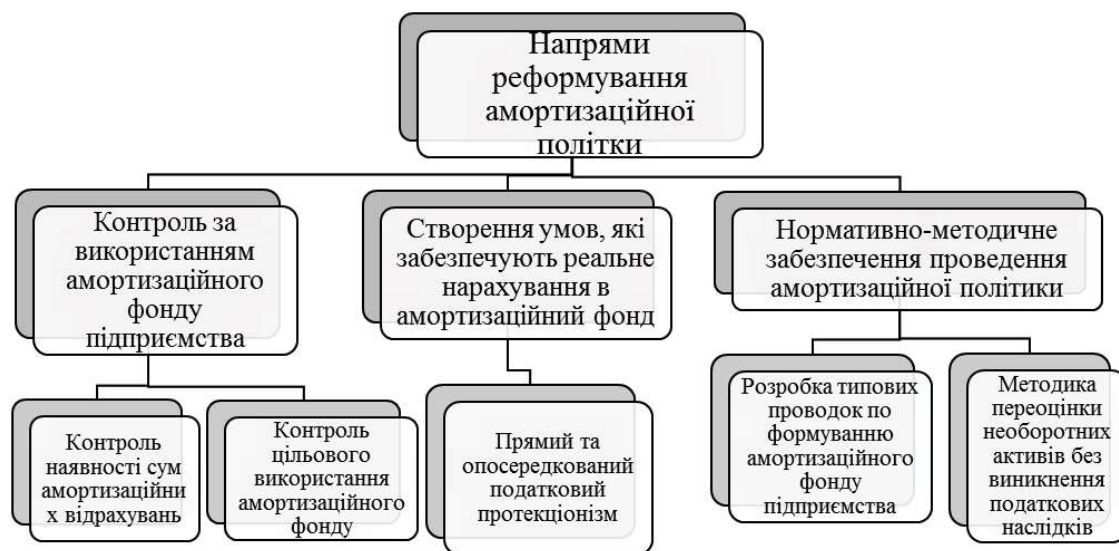
Рис. 2. Напрями реформування амортизаційної політики

Ніяка інша служба, крім облікової, питанням нарахування і накопичення амортизаційних сум не цікавиться. Інженерно-технічні і економічні служби підприємств на теперішній час складають плани розвитку з урахуванням наявних сум прибутку після оподаткування, який залишається в розпорядженні підприємства, і зовнішніх фінансових ресурсів (кредитів, інвестицій, грантів та ін.).