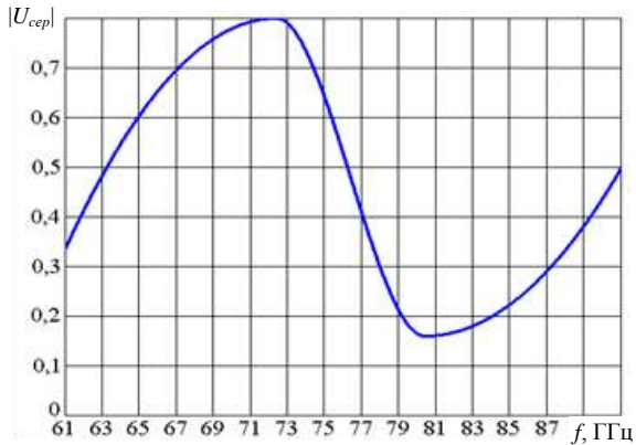
Рис. 2. Залежність від частоти середнього значення електричного поля нормованого на амплітуду збуджуючої хвилі

kR \sim 10 , kh \sim 10 . З огляду на середньостатистичні геометричні розміри яєчників цей діапазон можна визначити як 61 \text{ ГГц} \leq f \leq 151 \text{ ГГц} . На рис. 2 представлені результати розрахунків залежності середнього поля від частоти збуджуючої хвилі.