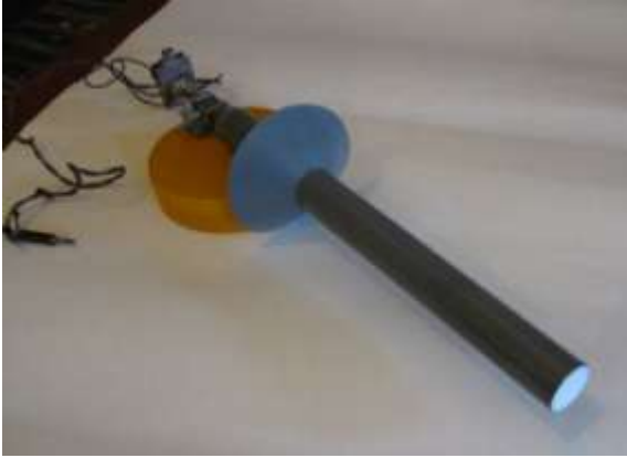
Рис. 4. Загальний вигляд рупорно-хвильоводної випромінюючої системи

У зв'язку з внутрішньоутробних лікуванням тварин, розкрив діелектричного хвильоводу випромінювача електромагнітної енергії було закрито діелектричною лінзою з параметрами: діаметр 26,4 мм; товщина 4,6 мм; фокусна відстань 50 мм. В результаті експериментальних досліджень рупорно-хвильоводного випромінювача було встановлено, що він на частоті 73,2 ГГц формує ширину головного пелюстка ДС в розкритті лінзи за рівнем -15 дБ 23,8 мм і ослабленням бічних пелюстків в межах -17,9 дБ.