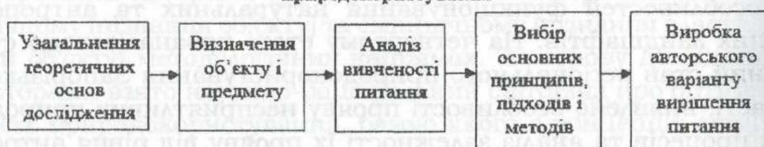
Рис. 2. Другий етап досліджень антропогенного впливу на ландшафти Запорізької області