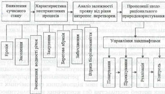
Рис. 4. Четвертий етап досліджень антропогенного впливу на ландшафти Запорізької області

Загальна закономірність полягає в тому, що чим більша площа виду природокористування і вищий індекс глибини перетвореності ландшафтів, тим більшою мірою ландшафт змінюється під впливом господарської діяльності. Показник, наближений до 10, свідчить про глибоку антропогенну перетвореність, а ближчий до 1 – про низький рівень її перетвореності.