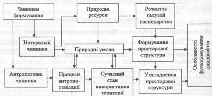
Рис. 3. Третій етап досліджень антропогенного впливу на ландшафти Запорізької області

Ступінь антропогенної перетвореності кожного з ландшафтів обчислено за формулою: