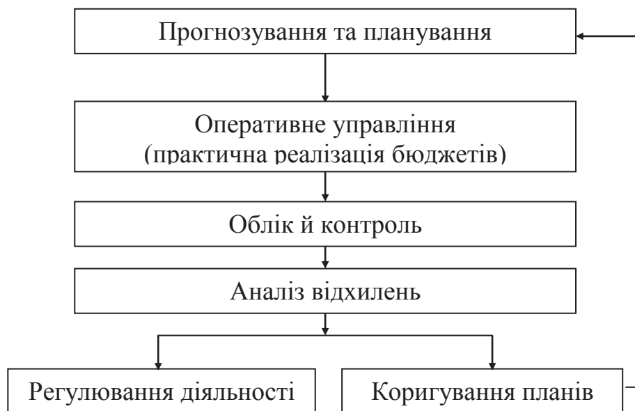
Рис. 2. Взаємозв'язок функцій управління

Схематично послідовність взаємозв'язку функцій управління відображено на рисунку 2.