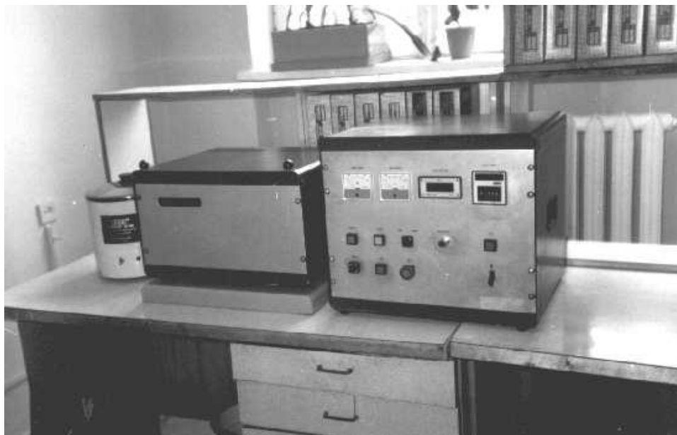
Рис. 1. Прилад для визначення динамічної міцності алмазних порошків типу Фрайтестер

Пробу порошку масою 2 карати завантажують у вузький сталевий циліндр із сталеву кулькою, що вільно переміщається усередині циліндра. Циліндр встановлюють на вал електромотору в спеціальній пристрій. При його обертанні забезпечується зворотно-поступове переміщення шарика в капсулі вздовж її осі. Пристрій фіксує по кількості обертів кількість циклів навантаження проби кулькою. При випробуванні зерна трошаться. Після визначеної кількості циклів пробу вивантажують, просіюють на ситах та визначають відсотковий вміст зерен на контрольних ситах. В результаті випробувань визначають кількість ударів кульки по зернах, які необхідні для руйнування 50 % зерен проби порошку. Проводиться, як правило, не менше двох випробувань. Зафіксована кількість циклів характеризує динамічну міцність порошку (індекс по Фрайтестеру Fi ).