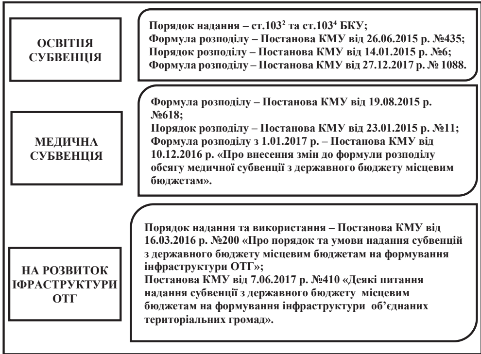
Рис. 4. Нормативно-правове забезпечення деяких видів субвенцій об'єднаних територіальних громад*