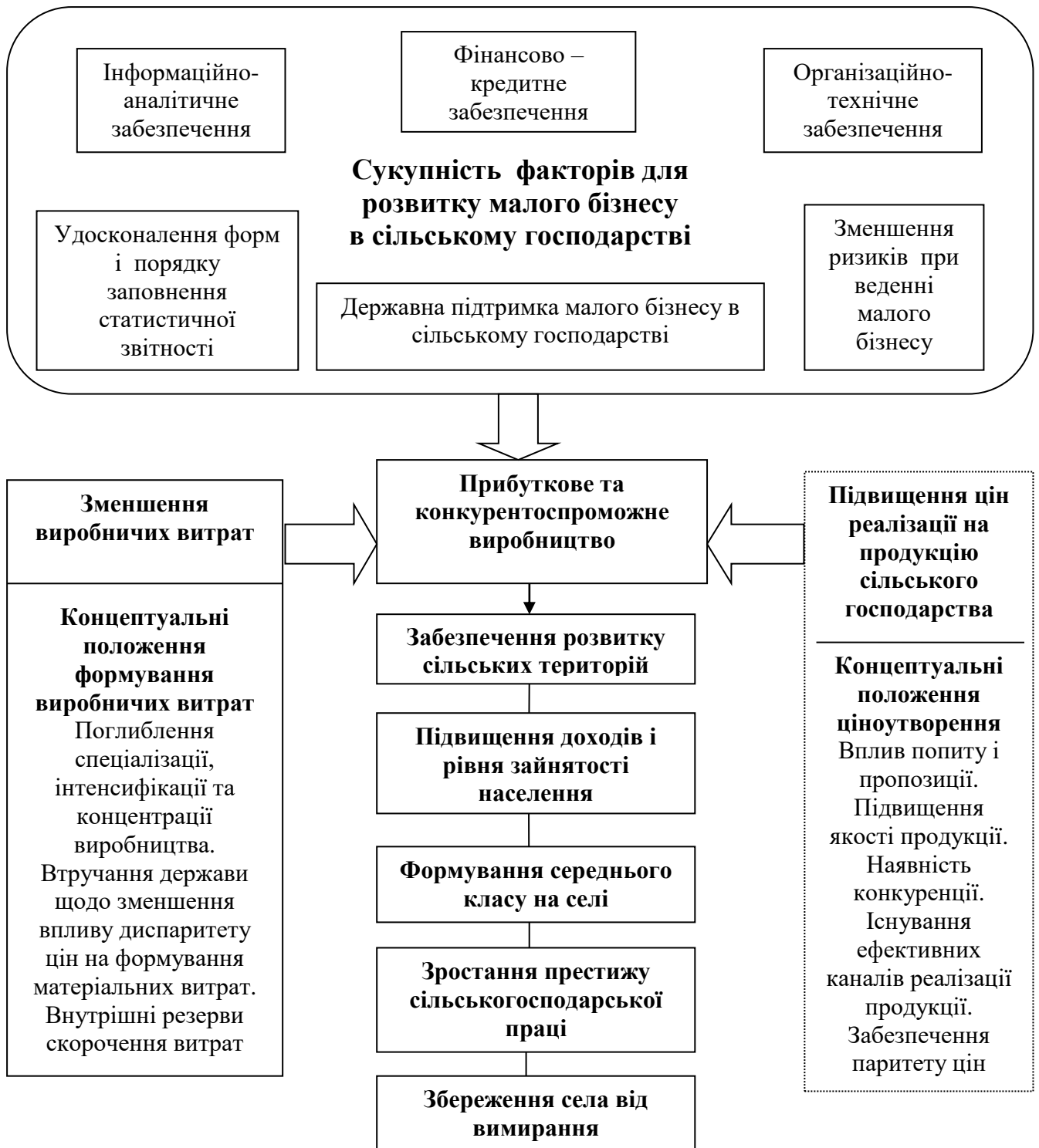
Рис. 1. Соціально-економічна концепція розвитку малого бізнесу в сільському господарстві