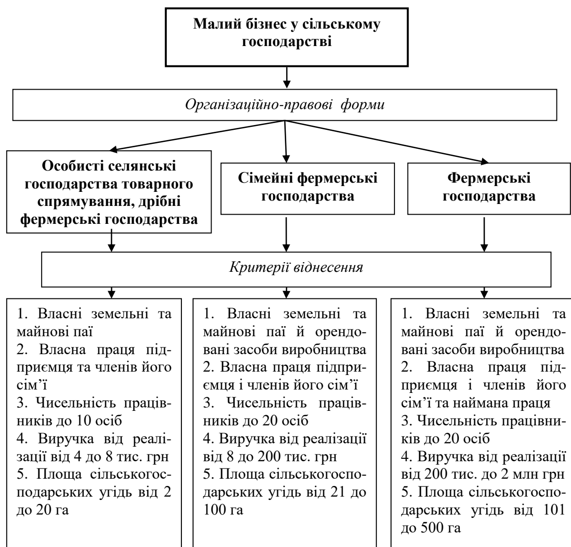
Рис. 2. Рекомендована класифікація малого бізнесу в сільському господарстві