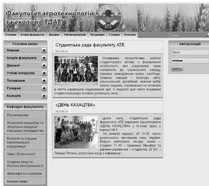
Рис.1. Головна сторінка інформаційної системи

Наявність на факультеті власного сайту дозволяє студентам та викладачам завжди бути у курсі того, що відбувається на факультеті, а проведення тестового контролю знань студентів дозволяє звільнити викладачів від ручної перевірки студентських робіт. Практичне значення отриманих результатів полягає в підвищенні якості знань студентів, підвищенні об'єктивності перевірки знань з дисциплін, а також забезпечення студентів та викладачів необхідною інформацією з життя факультету.