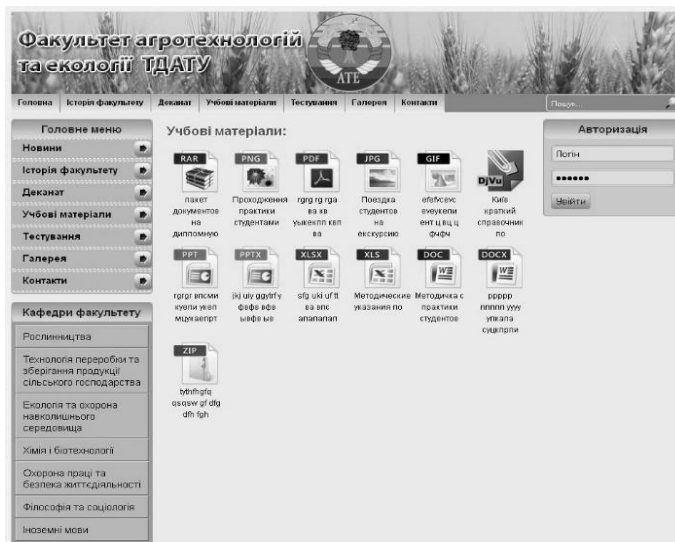
Рис.2. Сторінка з методичними матеріалами