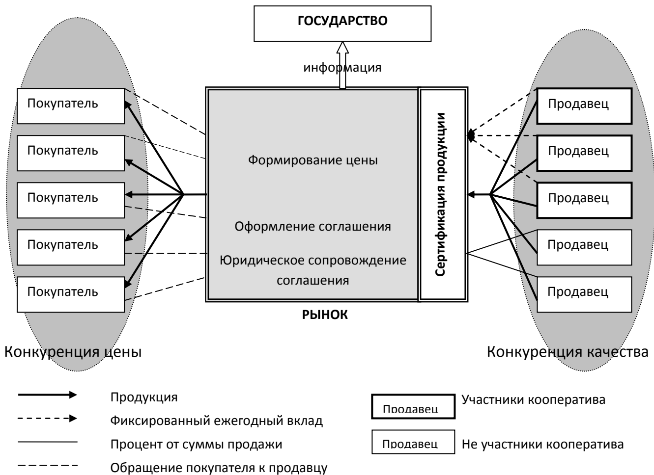
Рис. 2. Особенности функционирования оптового рынка на основе кооперации

Перспективным путем развития инфраструктуры аграрного рынка является качественное совершенствование биржевой торговли и аукционов, расширение ярмарочно-выставочной деятельности, а также создание обслуживающих кооперативов.