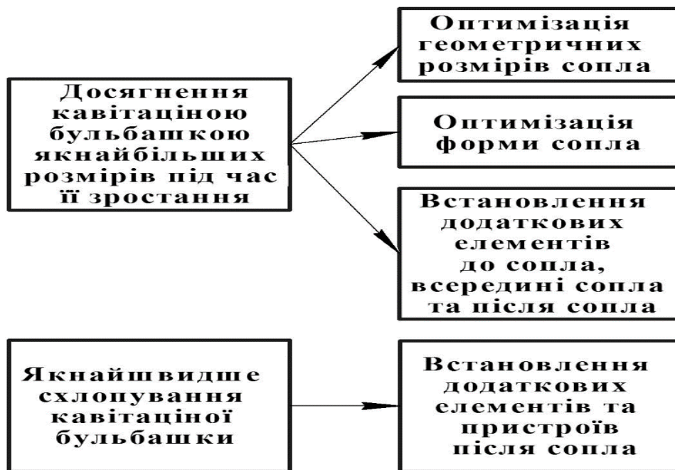
Рис. 2. Основні шляхи збільшення інтенсивності кавітації в соплі

Деякі з представлених вище процесів є мало дослідженими або навіть лише теоретично передбаченими на даний момент. Особливо це стосується проходження ядерних реакцій при схлопуванні кавітаційної бульбашки. Тим не менш, принаймні теоретично така можливість передбачена вченими, тому є необхідним вказати на неї в даній роботі. Тим не менш, представлений опис дозволяє прийняти технічні рішення стосовно застосування кавітації для інтенсифікації технологічних процесів, а також стосовно збільшення інтенсивності кавітації в зануреному соплі. Основними шляхами збільшення інтенсивності кавітації є забезпечення зростання бульбашки до якнайбільших розмірів та забезпечення якнайшвидшого схлопування кавітаційної бульбашки (рис. 2).