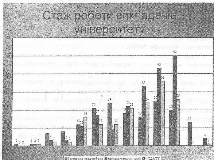
Рисунок 3. Стаж роботи викладачів

У той же час аналіз стажу роботи професорсько-викладацького складу Таврійського державного агротехнологічного університету станом на 01.09.2011 року показує такі результати (рис.3).