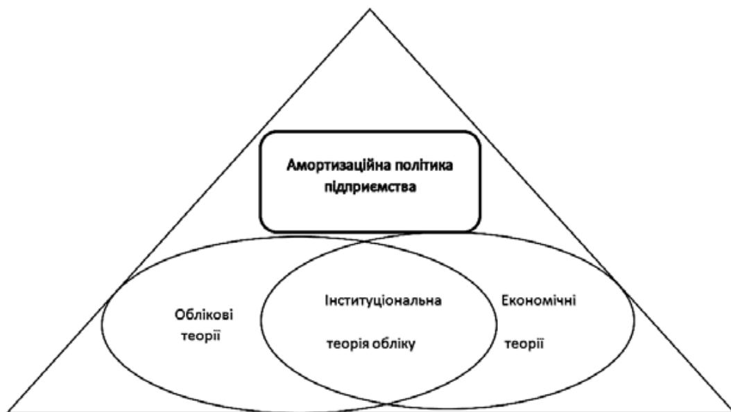
Рис. 2. Місце амортизаційної політики в економічних і облікових теоріях

Поглиблено інтерпретацію облікової складової сутності амортизаційної політики підприємства з урахуванням особливостей і принципів фінансово-економічного механізму відтворення. Таким чином формування амортизаційної політики підприємства передбачає використання складових системи бухгалтерського обліку, а саме інформаційну мережу, з каналами, по яких надходять дані про стан об'єктів обліку (основних засобів, амортизаційних відрахуваннях тощо).