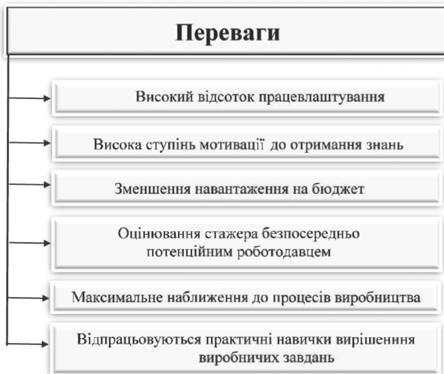
Рис.1. Сукупність можливих переваг дуальної освіти

Провівши аналіз літератури по дуальному навчанню, слід відзначити велику кількість можливих переваг такої освіти. Сукупність можливих переваг представлена на рис. 1