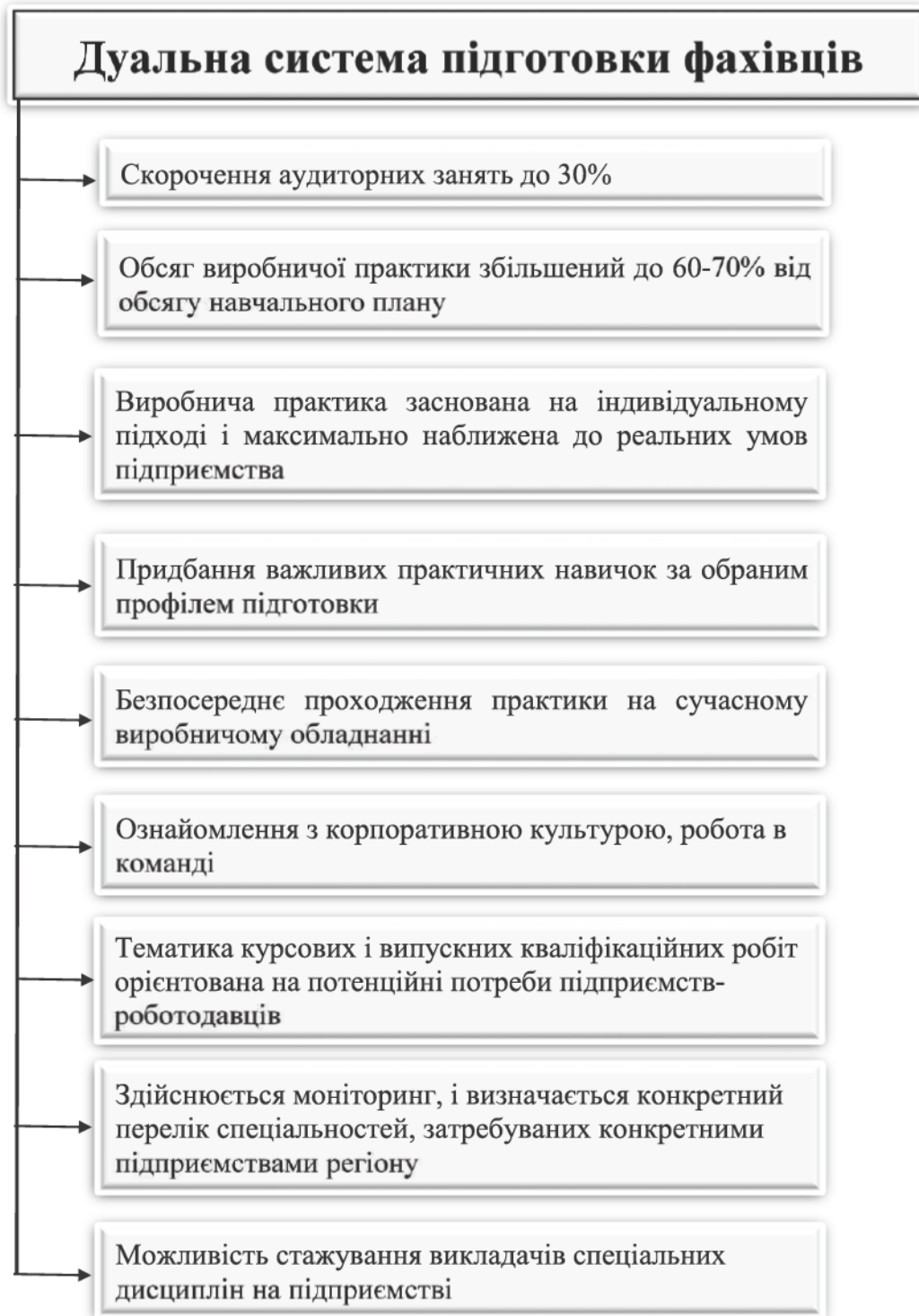
Рис. 2. Дуальна система підготовки фахівців

До основних принципів, які лежать в основі системи дуальної освіти, відносять: паритетність гуманістичних і ціннісних орієнтирів, компетентнісний підхід, становлення і розвиток професійної діяльності і соціально-професійних відносин. Відмінності між дуальною і традиційною системами підготовки наведено на рисунках 2 і 3.