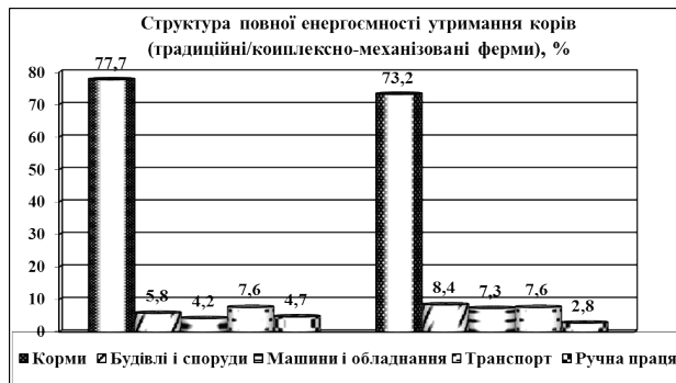
Рис. 1. Структура повної енергоємності утримання корів на традиційних і комплексно-механізованих фермах

Повна енергоємність утримання корови на фермі традиційного типу складає 30578,9 МДж., а на комплексно-механізованій – 30492,2 МДж. Структура повної енергоємності утримання корів в традиційних і комплексно-механізованих фермах приведена на рис. 1.