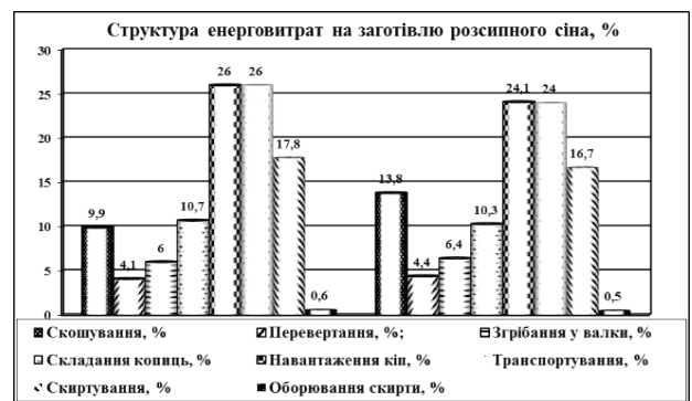
Рис. 4. Структура енерговитрат на заготівлю розсипного сіна

Основна питома вага витрат сукупної енергії при виробництві кормів із зеленої маси припадає на машини (13,7 - 32,0%), паливно-мастильні матеріали (19,0 - 67,5%) та витрати, пов'язані з виробництвом вихідної зеленої маси (5,9...34,3%). На рис. 4 представлена структура енерговитрат на заготівлю розсипного сіна.