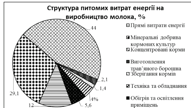
Рис. 2. Структура питомих витрат енергії на виробництво молока

У сукупній енергоємності виробництва молока питома вага кормів складає 60,4 - 61,4%; енергії засобів механізації, паливно-мастильних матеріалів і електроенергії – 10,0 - 11,2%, теплової енергії (обігрів приміщень, підігрівання води для доїльно-молочного блоку) – 22,2 - 22,5%.