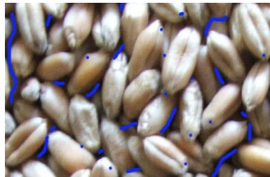
Рис. 3. Канал пористості між зерновками

Значення визначимо для каналу пористості між зерновками (рис.3)