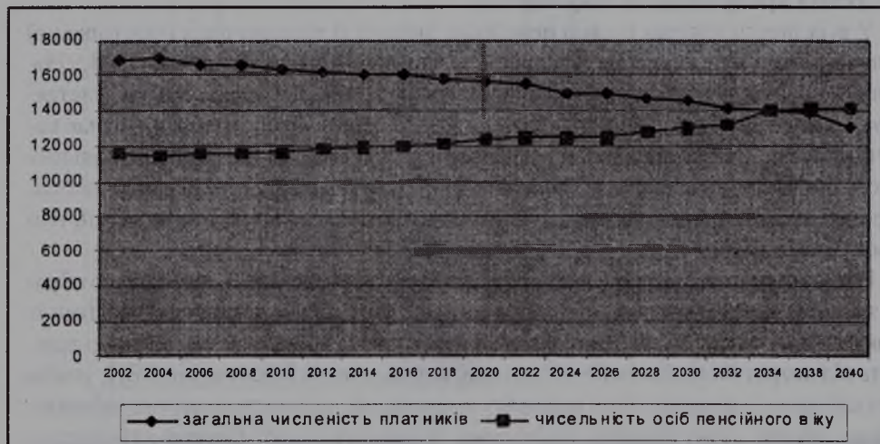
Рис. 2. Чисельність осіб пенсійного віку та загальна чисельність платників внесків (тис.осіб) [4]

Внаслідок невідворотних тенденцій щодо постаріння населення в Україні, як і в деяких країнах Європи, триватиме подальше зростання чисельності пенсіонерів по відношенню до працюючих. У зв'язку з цим рано чи пізно постане питання щодо фінансової спроможності пенсійної системи. Щоб збалансувати надходження і видатки Пенсійного фонду, доведеться приймати непопулярні рішення: або підвищувати тарифи внесків, або зменшувати розмір пенсій. Очевидно, що і перше, і друге рішення неприйнятним, бо вони не дадуть позитивних наслідків. У разі підвищення розмірів тарифів внесків, зросте кількість осіб, які ухиляються від їх сплати, посиляться тіньовий сектор економіки. Отже, альтернативи реформам немає. На відміну від інших країн, де проводилась пенсійна реформа, в Україні за нормами нового пенсійного законодавства було пе-