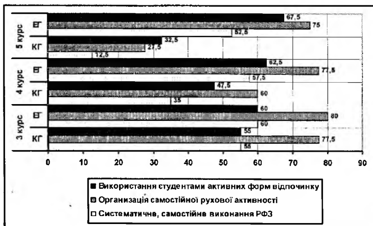
Мал.2. Динаміка самостійної рухової активності студентів ВНЗ на старших курсах навчання (%)

В структурно логічній схемі ЗЗК студентів у процесі занять з фізкультури розвиток інформаційного компонента займає високе місце. На всіх етапах розвитку він націлює студента на вибір активної життєвої позиції в фізкультурно-оздоровчій сфері, спрямованій на збереження і закріплення індивідуального здоров'я, через збільшення обсягу знань, умінь і навичок в організації самостійного рухового режиму. Інформаційний компонент дозволяє студентам включитись у творчу діяльність, обґрунтовану на отриманих знаннях. Він орієнтує студентів на самостійне вивчення питань збереження здоров'я, найбільш для них значущих. Інформація про збереження і закріплення здоров'я поступає до студентів з різних джерел: засобів масової інформації, розповідей, стендів, відеозаписів, бесід і т.д. У нашому дослідженні блок інформації подається у формі розповідей, бесід, розділів на стендах та ін. Прояв інформаційного компонента характеризується засвоєнням студентами отриманих у період навчання знань з основ СПВ і можливістю їх використання у повсякденній діяльності для закріплення індивідуального здоров'я. Проведене попереднє дослідження дозволило зробити висновок, що на початковому етапі немає достовірної різниці за рівнем знань основ ЗЗК у студентів контрольної і експериментальної груп (таблиця 3; мал. 3).