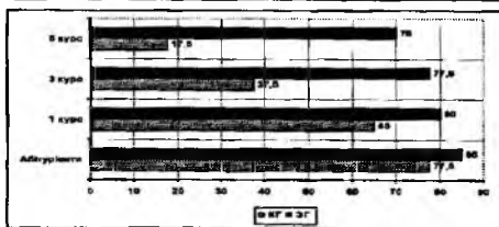
Мал. 1. Динаміка виконання студентами загартувальних процедур (%)