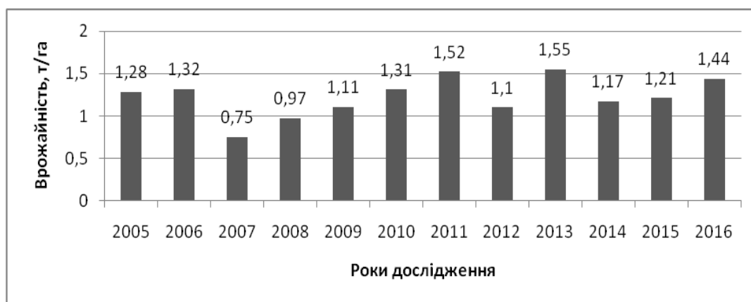
Рис. 3. Середня врожайність соняшнику по Мелітопольському району, т/га.

Основним вирішальним чинником обмеження продуктивності соняшнику в умовах природного зволоження Південного Степу України виявилася недостатня кількість атмосферних опадів, особливо у період формування кошиків та цвітіння. Через нестачу вологи зменшується відносна вологість повітря в період цвітіння, що негативно впливає на процес запилення квіток соняшнику і призводить до зниження врожаю і його сильного варіювання по роках. Середня врожайність соняшнику по роках коливалася в межах від 0,97 до 1,55 т/га (рис. 3).