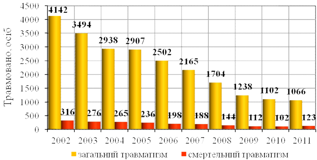
Рис. 1. Травматизм в АПК за 2002-2011 роки.