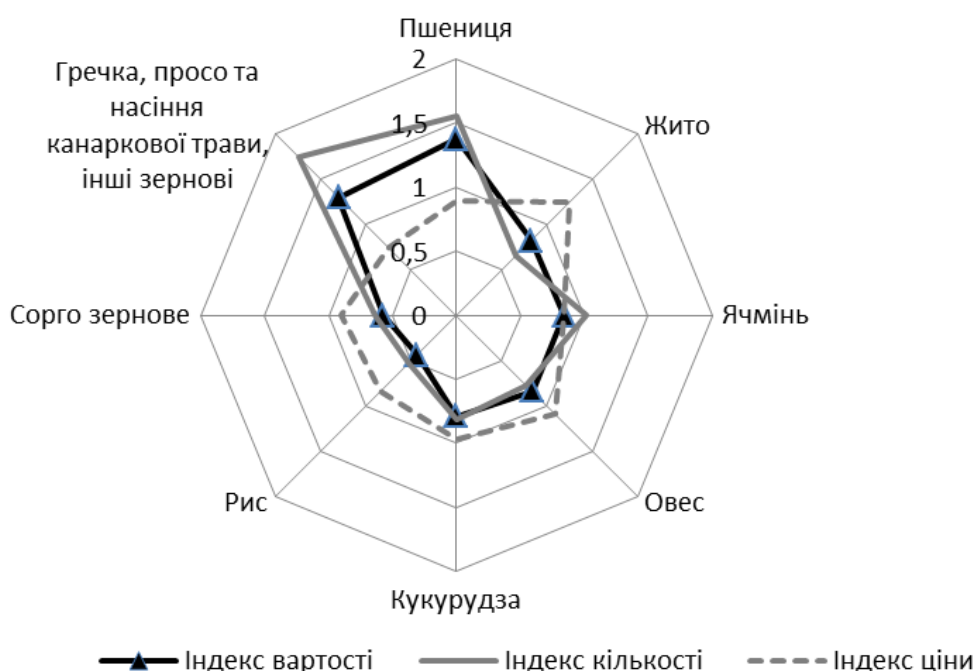
Рис. 2 Індекси зміни вартості українського експорту зернових у 2015-2016 рр. за факторами впливу

- нарощування обсягів експорту за рік мало місце по трьох товарних підгрупах: 1001 (на 55%), 1008 (на 74%) та 1003 Ячмінь (на 12%);