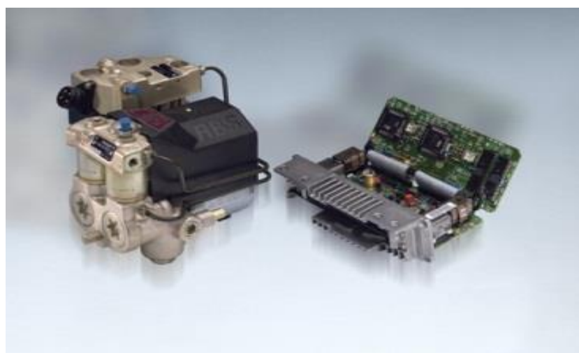
Рис. 3. Электронный блок управления

Электронный блок управления фиксирует сигналы от датчиков и дает команды механизму гидравлического управления на регулировку тормозного усилия, чтобы предотвратить блокировку колес и сохранить управляемость автомобиля, то есть предотвратить занос.