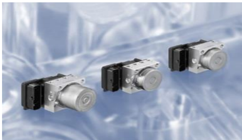
Рис.2. Датчик скорости вращения колес

Электронный блок управления фиксирует сигналы от датчиков и дает команды механизму гидравлического управления на регулировку тормозного усилия, чтобы предотвратить блокировку колес и сохранить управляемость автомобиля, то есть предотвратить занос.