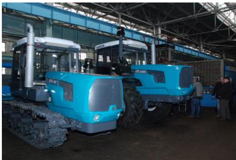
Рис. 2. Модельный ряд тракторов АО "ХТЗ"

Выводы. В целом созданная двухпоточная бесступенчатая гидрообъемно-механическая трансмиссия для линейки колесных тракторов АО «ХТЗ» обеспечивает улучшенные массово-габаритные характеристики, улучшенные условия работы гидрообъемной передачи в условиях холодного запуска двигателя и экстренного торможения транспортного средства.