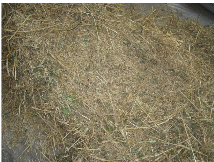
Рисунок 1 – Очесанный ворох пшеницы

Основная часть. Как известно, при работе очесывающего устройства навешенного на комбайн или уборочную машину получается очесанный ворох (рис. 1).