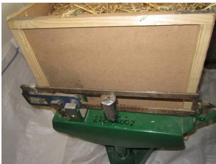
Рисунок 2 – Взвешивание отобранных проб очесанного вороха

Методика проведения экспериментов заключалась в следующем. В специально изготовленный деревянный ящик размерами 0,5 \times 0,5 \times 0,5 м, отбирались пробы очесанного вороха, которые впоследствии взвешивались на весах (рис. 2).