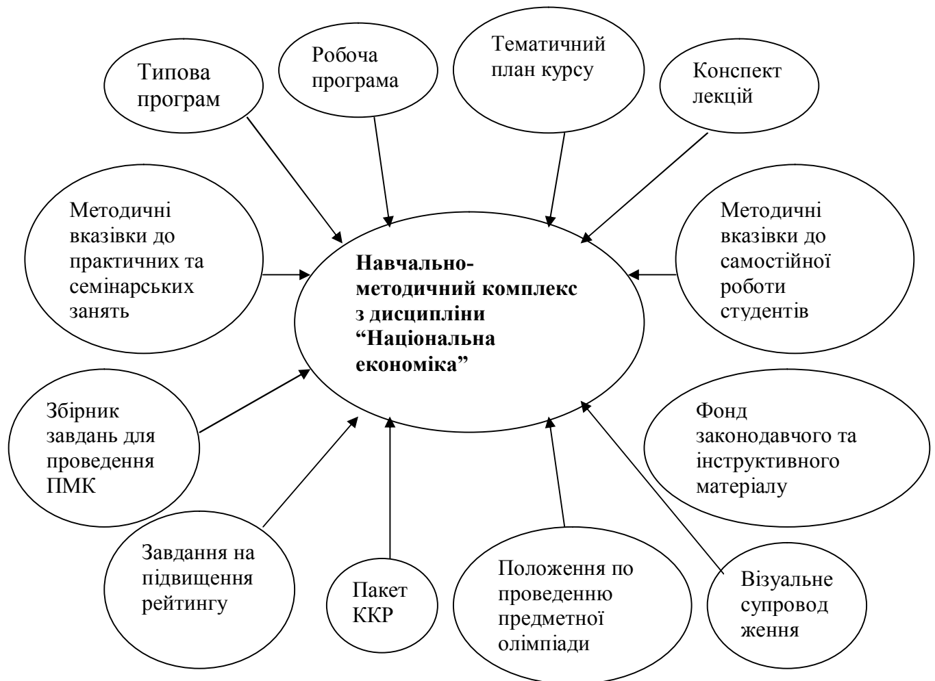
Рис.2 Структура навчально-методичного комплексу з дисципліни “Національна економіка”.

Склад навчально-методичного комплексу з курсу “Національна економіка” наведено на рис. 2 [5, с. 5].