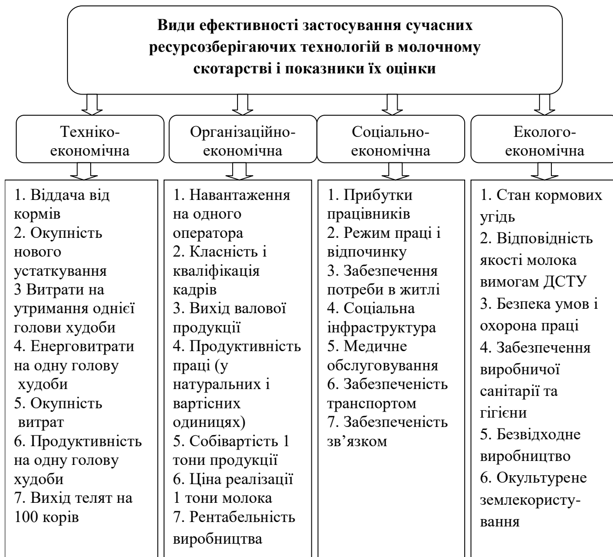
Рис. 1. Система показників ефективності застосування ресурсозберігаючих технологій в молочному скотарстві

матеріального стану підприємства, але і в поліпшенні соціальних умов, організації праці, екологічній ситуації і т. д. В результаті досліджень нами запропонована структурно-методична схема показників оцінки ефективності застосування ресурсозберігаючих технологій, що дозволяє комплексно визначити доцільність їх впровадження і подальшого використання, виявити "слабкі" місця і оперативно прийняти заходи для їх усунення (рис. 1).