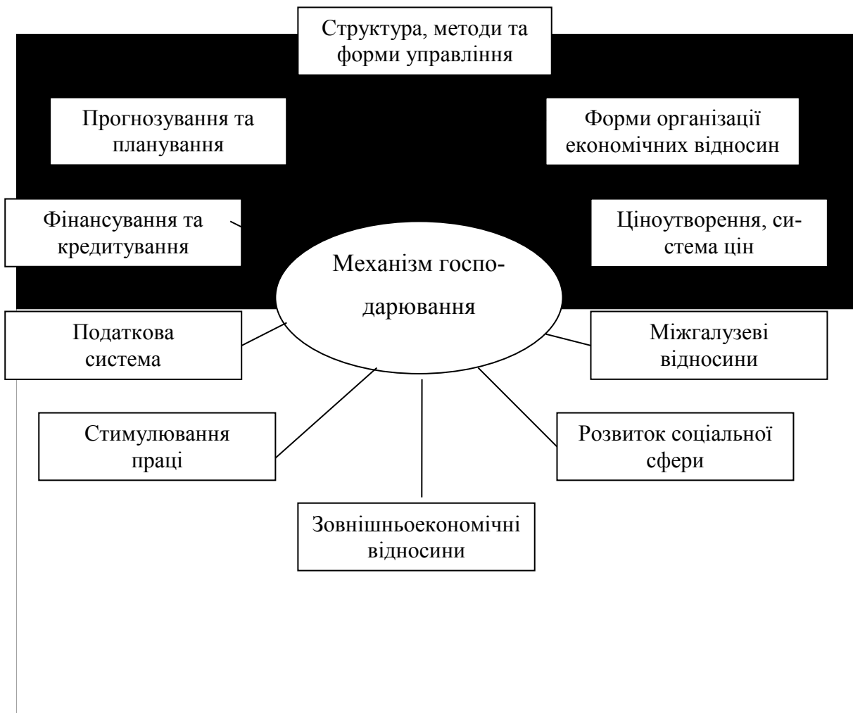
Рис. 1. Основні елементи механізму господарювання АПК

На сучасному етапі розвитку аграрної економіки наступив той час, коли необхідно створювати умови, які б сприяли зростанню ефективності функціонування сільськогосподарських товаровиробників всіх організаційно-правових форм. Інакше кажучи, необхідне створення нового механізму господарювання, що припускав би корінні зміни сформованих уявлень і реальний перехід на переважно економічні засоби і методи управління (рис. 1).