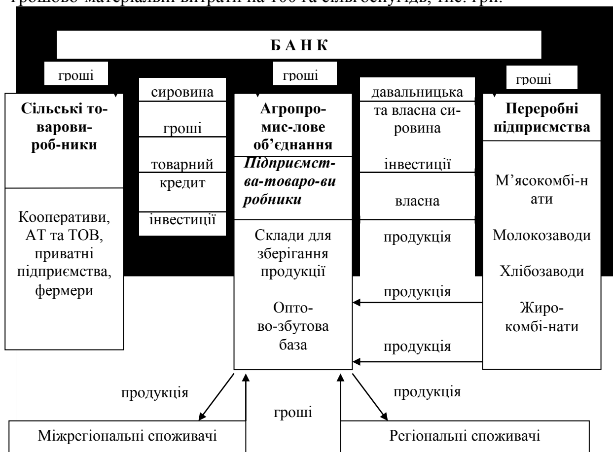
Рис. 4. Схема взаємозв'язків у інтеграційному об'єднанні

де: x_1 – частка зернових у виручці, %; x_2 – частка картоплі у виручці, %; x_3 – частка молока у виручці, %; x_4 – частка м'яса свиней у виручці, %; x_5 – частка м'яса ВРХ у виручці, %; x_6 – бал бонітету ґрунтів; x_7 – фондооснащеність, на 100 га сільгоспугідь; x_8 – забезпеченість робочою силою на 100 га сільгоспугідь, чол.; x_9 – грошово-матеріальні витрати на 100 га сільгоспугідь, тис. грн.