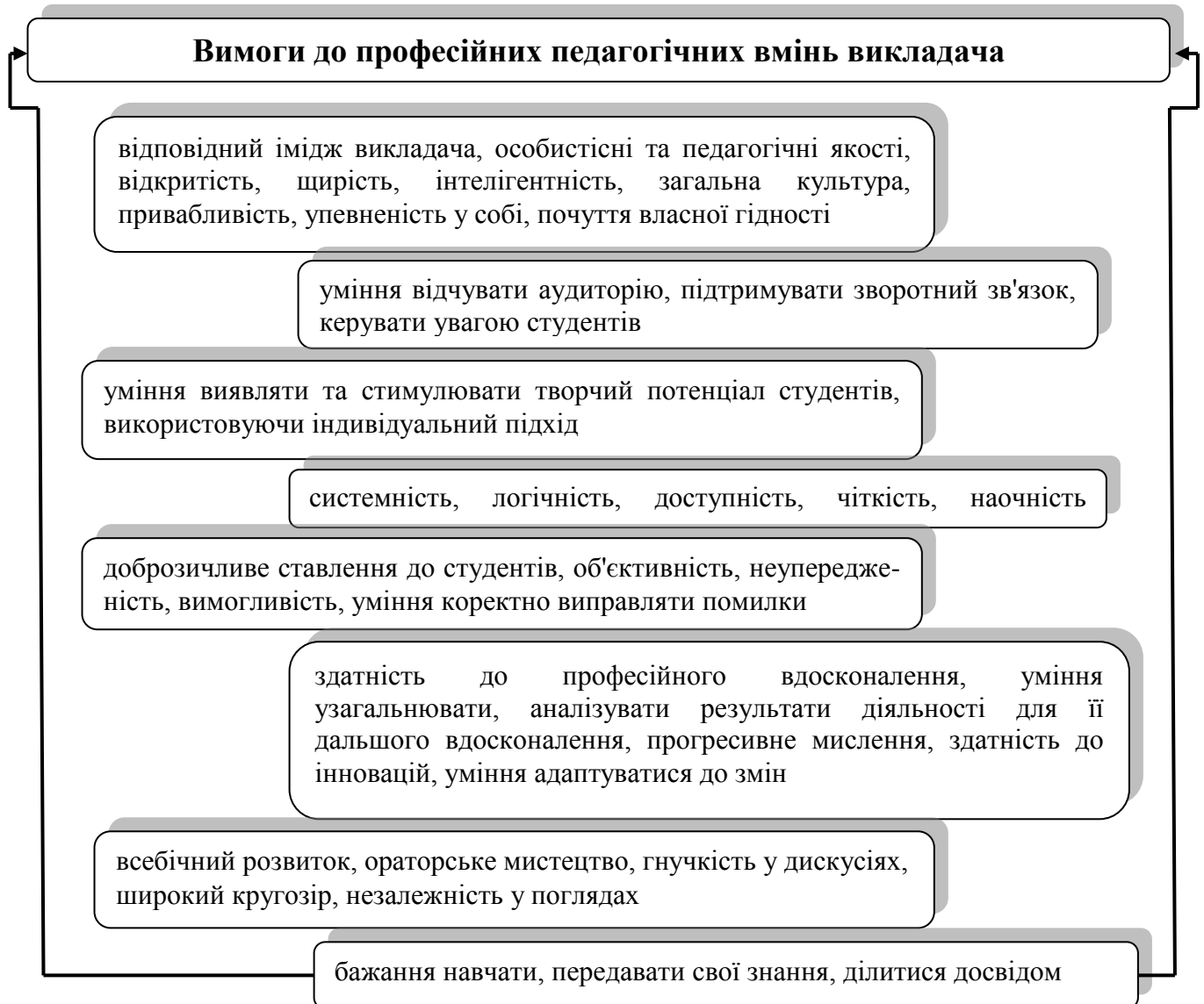
Рис. 2. Вимоги щодо професійної майстерності та вмінь викладача

Реальний педагогічний процес складається з багатьох компонентів, всі їх можна класифікувати за трьома головними аспектами освітньої діяльності: змістовним, методичним та соціально-психологічним. При цьому провідну роль мають відігравати поглиблене знання предмета, уміння підбирати, адаптувати зміст навчального матеріалу до потреб відповідної навчальної групи, визначати мету і завдання освітньої діяльності, реалізовувати навчальний процес відповідно до потреб і можливостей студентів, контролювати його результативність, здійснювати оптимальний розподіл матеріалу за часом та активізацію його сприйняття, виокремлення ключових ідей, використання інноваційних та інтенсивних навчальних технологій.