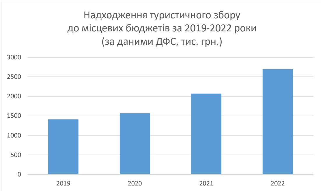
Рис. 3. Надходження туристичного збору до місцевих бюджетів за 2019-2022 роки (за даними ДФС, тис. грн.)

Туристичний збір у 2022 році зріс на 30,4% порівняно з 2021 роком. Сума перевищує 2,7 мільйона гривень, найбільша частка – у прибережних зонах. Однак ці збори стягуються лише з «офіційних» туристів, які купують квитки. Частка туристичного збору у загальних надходженнях місцевих бюджетів у 2022 році становила 3,8% по регіонах, зменшившись на 0,1% порівняно з 2021 роком. У 2022 році Запорізька область посіла 6 місце за обсягом збору, випередивши Херсонську, Харківську та Дніпропетровську області.