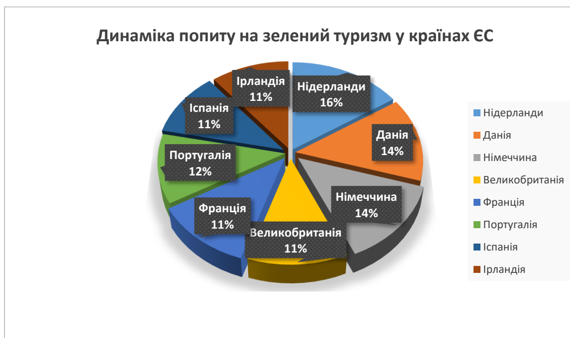
Рис. 2. Динаміка попиту на зелений туризм у країнах ЄС