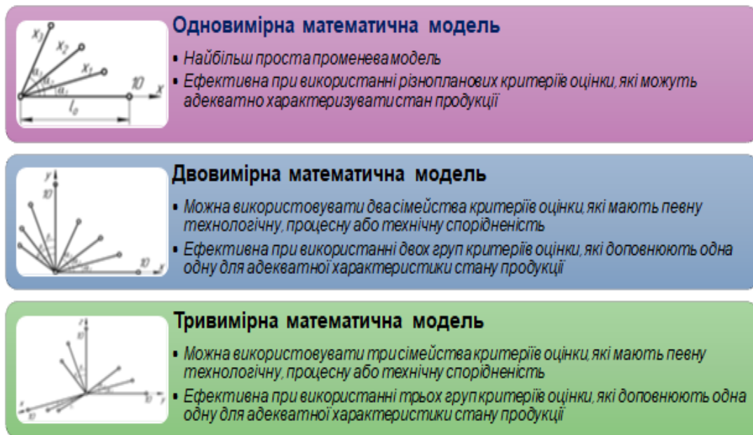
Рис. 1. Променеві математичні моделі якості: одновимірна, двовимірна та тривимірна

Реалізуючи променеву математичну модель, безрозмірні параметри зразків продукції відкладаються відтинком променя під певних кутом до певного базового напрямку. Виявилось достатньо зручним вибирати за базовий напрямок напрями осей декартової системи координат. Це дозволяє створювати сімейства променів, що базуються навколо однієї осі, що можна асоціювати із полярною системою координат; навколо двох осей, що подібно плоскій декартовій системі координат та навколо трьох осей, як для просторової декартової системи координат (рис. 1).