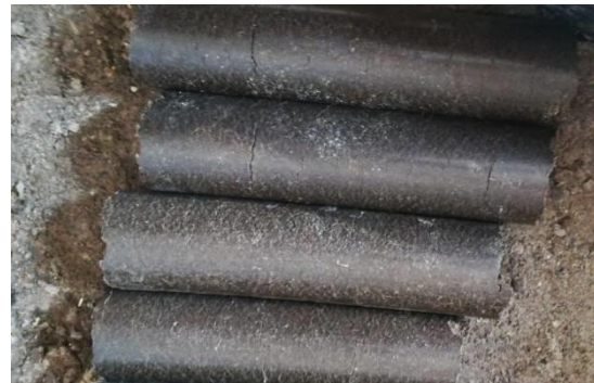
а) брикет при температурі 114°С б) брикет при температурі 84°С