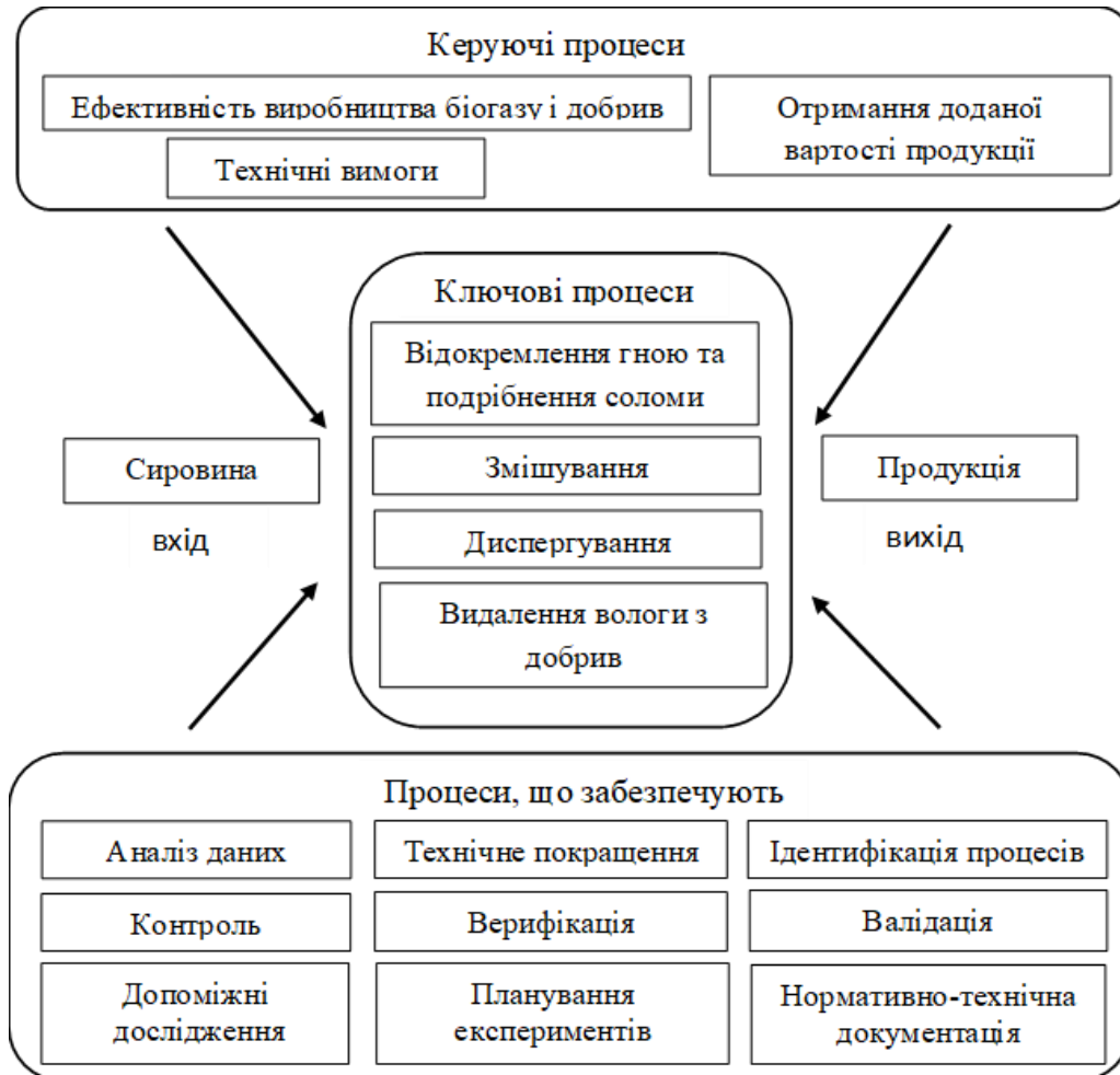
Рис. 1. Карта процесів біогазової установки

При описі процесу мають бути враховані компоненти, необхідні для належного функціонування [23]: визначити межі процесу; встановити вимоги до нього; ідентифікувати вхідні та вихідні потоки; визначити основні показники.